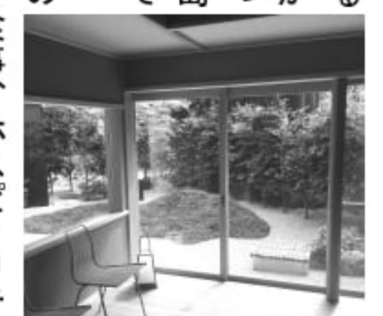
サロンから眺める中庭