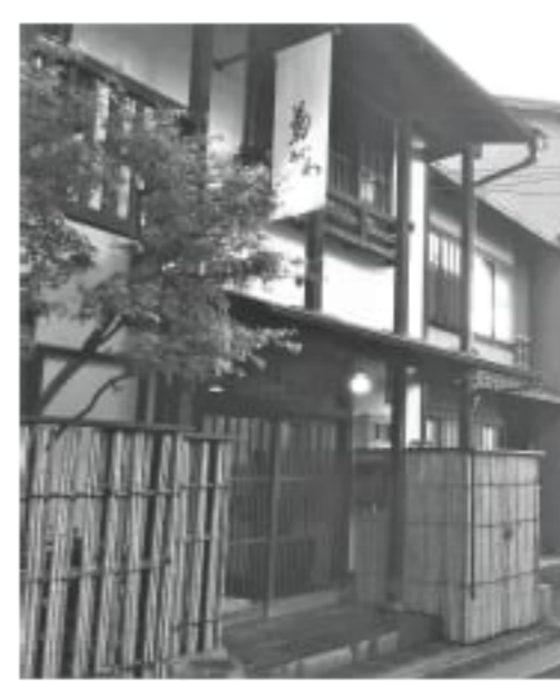
「蔵島東門前菊がわ」さん

界を助けるため、行政の補助によって地元の宿にお得に泊まることのできるのとこと、今回、地元である宮島の宿に泊まってみました!