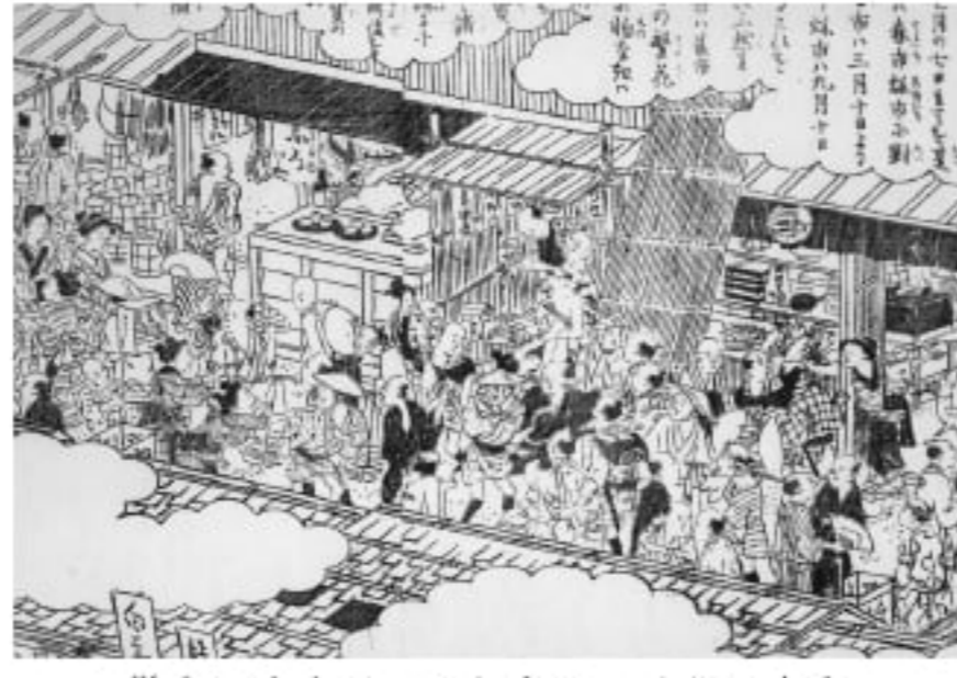
蔵島図会より 賑わう江戸時代の宮島

町家通りは、かつて宮島の表参道として栄えた通りで、現在では伝統的な町家建築の古民家やカフェ、島民のための商店などが入り混じる、情緒漂う通りです。