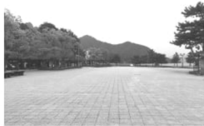
屋間の宮島桟橋前広場 (4月頃)