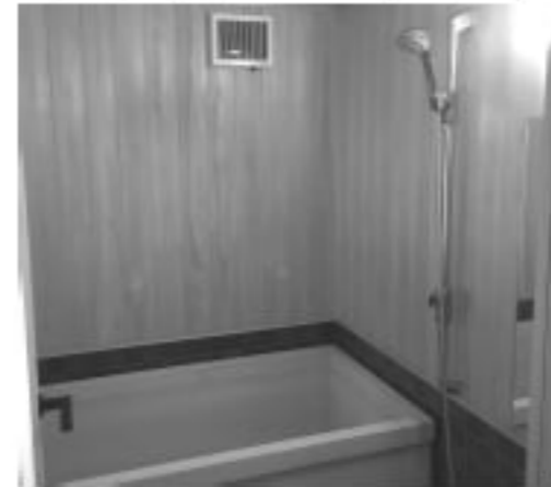
部屋付きの大きな檜風呂

また、頂いた夕食も丁寧に手が掛けられた和洋折衷の創作料理で、おもてなしの心を強く感じるものでした。これまで近