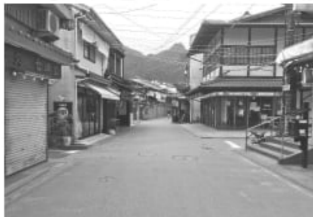
屋間の宮島の商店街 (4月頃)

人が集まる観光地はリスクが高いという不安がある中、私たちは島で働くものとして「宮島から絶対にコロナを出さない」という強い信念を持ち、感染予防対策を徹底し、お客様に安心してお越しいただく準備はできています。